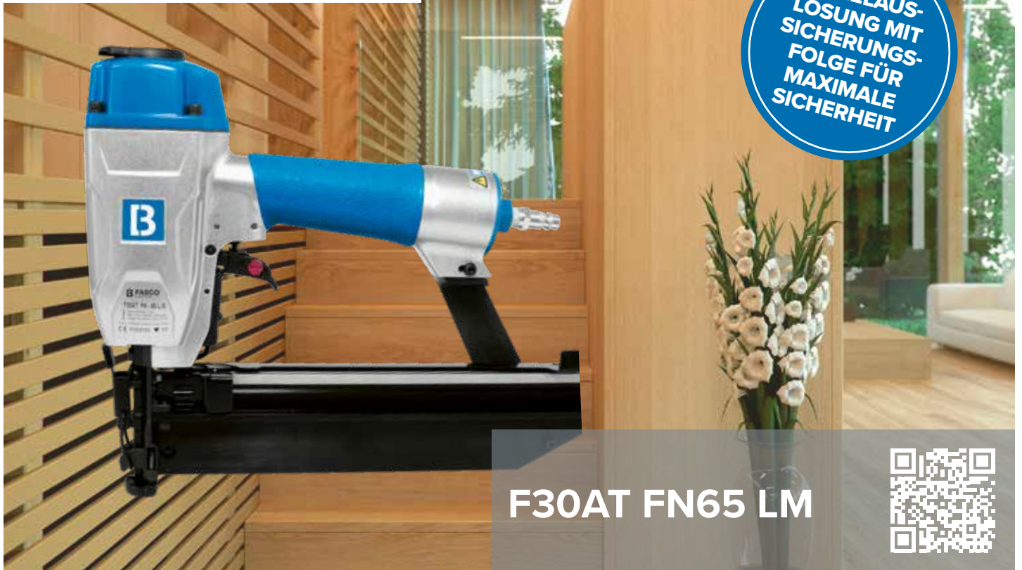
F30AT FN65 LM